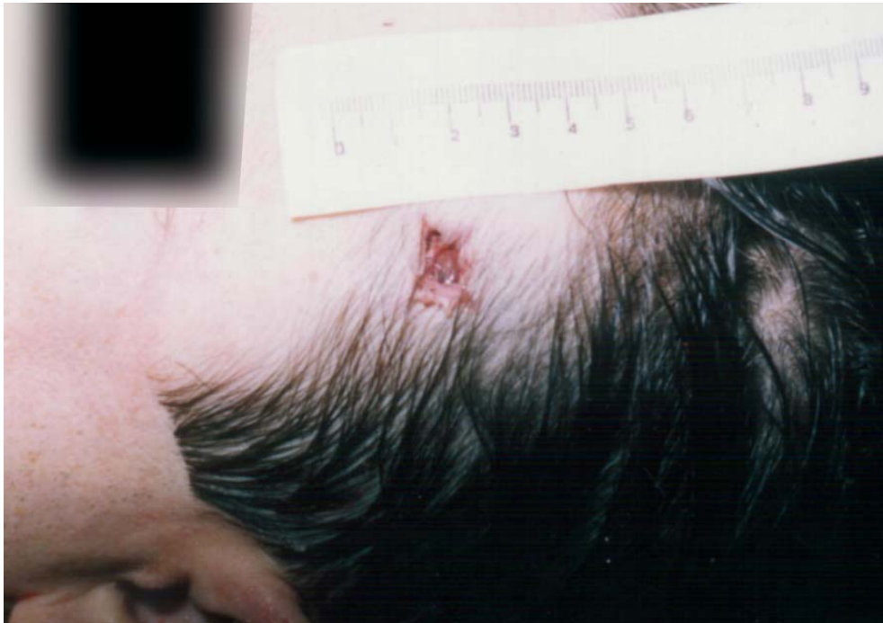
Figura 2.- Orificio de salida en herida por arma de fuego de proyectil único.