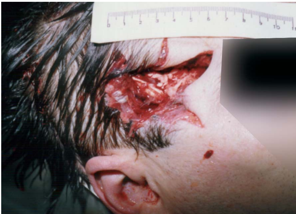
Figura 1.- Orificio de entrada en herida por arma de fuego a cañón tocante

Varón de edad aproximada de 40 años, que ingresa en un servicio de urgencias hospitalario en estado agónico presentando dos heridas por arma de fuego a nivel parietal izquierdo y derecho respectivamente. Tras su fallecimiento en la autopsia practicada se evidencia que la herida ubicada en la región parietal derecha presenta una morfología estrellada, irregular, con cavidad anfractuosa, por el despegue de tegumentos junto a depósitos negruzcos; características propias de orificio de entrada de una herida por arma de fuego a cañón tocante. La situada en la región parietal izquierda presenta una morfología ovalada de un centímetro de diámetro aproximado, con los bordes ligeramente evertidos; orificio de salida. Igualmente se aprecia en el examen externo otras lesiones asociadas como son hematoma en gafas y epixtasis.