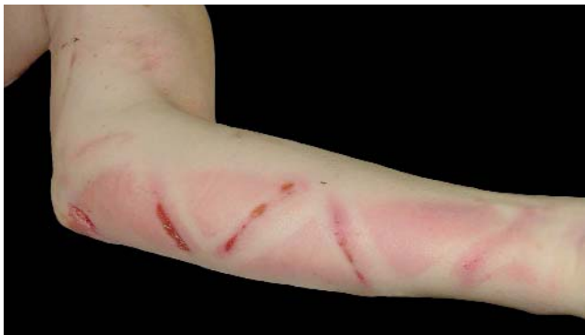
Figura 2.- Combinación de contusión y laceración en la piel de la cara interna del brazo izquierdo que remedan el mismo dibujo de la figura anterior.