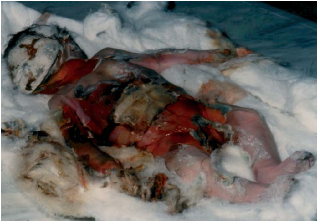
Figura 2.- Examen externo del cadáver.