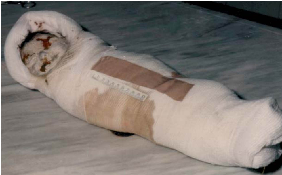
Figura 1.- Examen externo del cadáver.

Los procesos de descomposición cadavérica dificultan, de forma muy importante, la labor del Médico Forense en el esclarecimiento de la causa de la muerte. Podemos decir, que esta dificultad es directamente proporcional al tiempo transcurrido entre la muerte y el hallazgo del cuerpo o de la práctica de la autopsia. En ocasiones, sin embargo, aparecen los fenómenos conservadores del cadáver que, de forma natural, retrasan o impiden el desarrollo de la putrefacción y corificación. En este caso se presentó denuncia en el Juzgado transcurridos diez meses de la muerte, procediéndose entonces a la exhumación y posterior autopsia. La apertura del cuero cabelludo puso al descubierto un acumulo sanguíneo en región parietal derecha. La apertura de la calota craneal evidenció la existencia de un hematoma intraóseo localizado al mismo nivel. El cerebro no pudo examinarse por encontrarse muy deteriorado. La investigación judicial posterior descubrió la existencia de un golpe del recién nacido en el cráneo contra el borde de la pila de baño, al resbalar en la sala de matronas cuando le realizaban el aseo, que en la investigación preliminar había sido silenciado.