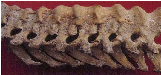
Figura 8.- Sinostosis por osificación del ligamento longitudinal anterior; hallazgo típico de la enfermedad de Forestier-Rotés Querol.