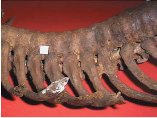
Figura 4.- Detalle de la columna vertebral donde se aprecia claramente la fusión intervertebral y en las articulaciones costovertebrales.