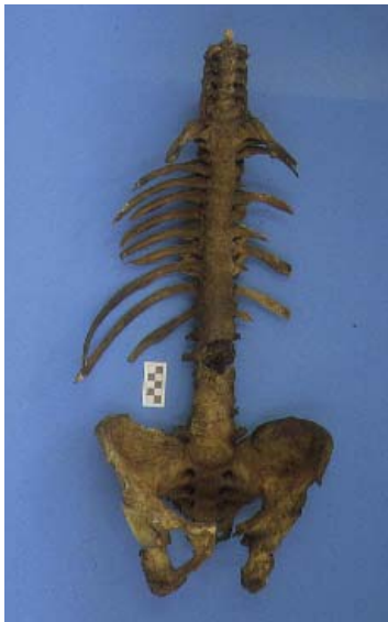
Figura 1.- Columna vertebral "en caña de bambú".

En el presente artículo, los autores revisan la importancia de la patología ósea como factor de identificación personal en antropología forense a raíz de un caso de espondilitis anquilosante. En el caso expuesto, se trataba de establecer la identificación de un individuo del que se conocía el lugar del enterramiento, si bien presentaba la particularidad de ser un panteón familiar donde reposaban los restos de varios familiares allí inhumados. Debido al conocimiento del padecimiento en vida por parte del sujeto problema de una patología ósea con importantes alteraciones esqueléticas, como es la espondilitis anquilosante, pudo concluirse una identificación personal positiva tras el pertinente estudio antropológico.