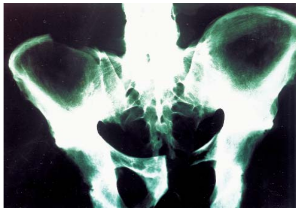
Figura 3.- Radiografía A-P de pelvis que muestra el borramiento de las articulaciones sacrílicas.