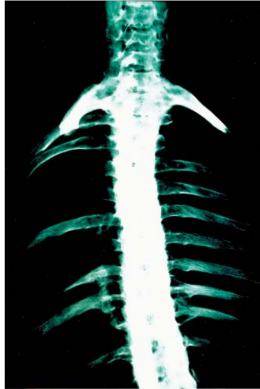
Figura 5.- Radiografía A-P de columna vertebral con fusión generalizada de articulaciones costo-vertebrales.