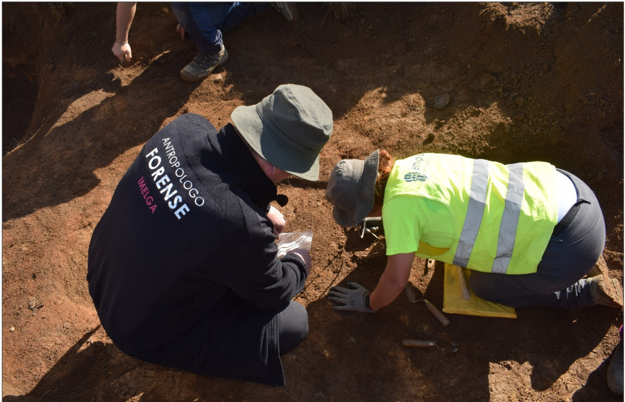
Figura 2. Trabajos de exhumación de la Fosa de Vilagarcía de Arousa (Noviembre de 2021) en la que intervino la Unidad de Antropología Forense del Instituto de Medicina Legal de Galicia en la búsqueda de 11 individuos asesinados entre agosto de 1936 y febrero de 1937. En la imagen tomando muestras del sedimento de la fosa común del cementerio de Vilagarcía de Arousa.

40 casos (17). Posteriormente al año 2010 se han investigado nuevos casos a solicitud de otros Juzgados.